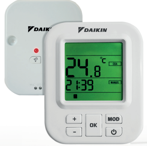
Kablosuz Otomatik Kontrol Cihazı